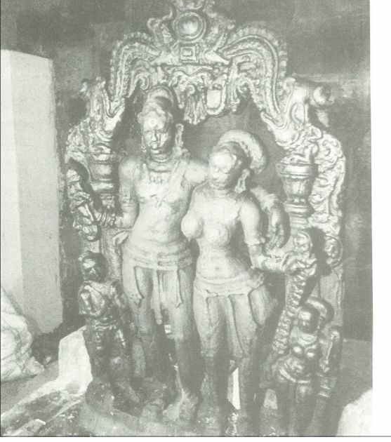
நுளம்பர் நாட்டுச் சிற்பம், ரதி மன்மதன், திருலோக்கி சுந்தரேஸ்வரர் கோயில், படங்கள் (3) வழங்கி உதவிய திரு. இரா.மோகன், கங்கை கொண்ட சோழபுரம் மேம்பாட்டுக் குழுமம்.